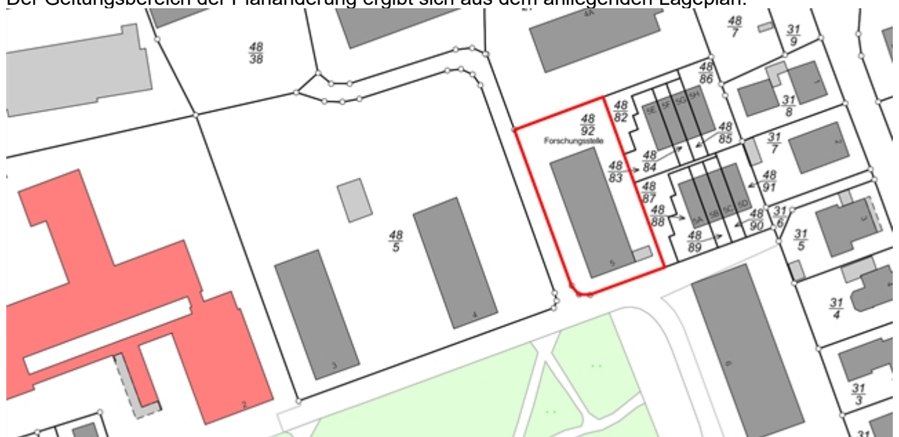
Geltungsbereich 1. Änderung Bebauungsplan Nr. 61 „An der Mühle“

Aufgrund des § 2 Abs. 1 des Baugesetzbuches (BauGB) in der Fassung der Bekanntmachung vom 23.09.2004 (BGBl. I S. 2414) und aufgrund des § 58 des Niedersächsischen Kommunalverfassungsgesetzes (NKomVG) vom 17.12.2010 (Nds. GVBL. S 576) – alle Bestimmungen in der jeweils aktuellen Fassung - wird die Einleitung eines Verfahrens zur 1. Änderung des Bebauungsplanes Nr. 61 „An der Mühle“ beschlossen. Der Geltungsbereich der Planänderung ergibt sich aus dem anliegenden Lageplan: