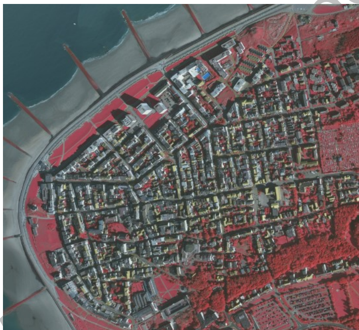
Abbildung 1: Spektralbild Innenstadt Norderney

Die versiegelten Flächen sind im innerstädtischen Bereich um ein Vielfaches höher. Demzufolge ist der Erhalt des derzeit geringen Baumbestandes im Innenstadtbereich entsprechend zwingend erforderlich. Der Wegfall bzw. die starke Reduzierung des Baumbestandes im Innenstadtbereich würde den Naturhaushalt auf einer Gesamtfläche von ca. 83 ha nachhaltig schädigen. Der Baumbestand befindet sich im Stadtgebiet überwiegend vor den Häusern im Vorgartenbereich und trägt somit zusätzlich zum Ortsbild bei.