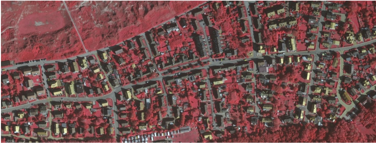
Abbildung 2: Spektralbild Nordhelmsiedlung Norderney; NLWKN

Hauptziel der Baumschutzsatzung ist es, den Naturhaushalt für die gesamte Insel zu schützen und die damit einhergehenden Aspekte in Bezug auf Gesundheit, Luft, Wohn- und Lebensqualität auf der Insel in besonderem Maße zu erhalten.