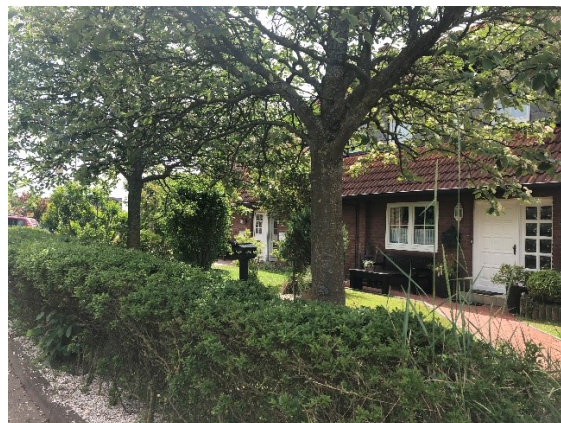
Abbildung 6: Vorgarten Up Süderdün (2020)