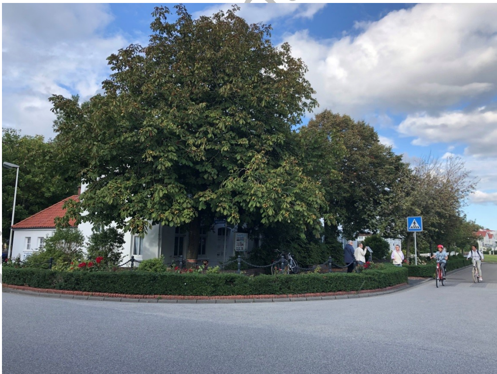
Abbildung 5: Straßenzug Marienstraße(2019)

In den Bereichen der Wohngebiete (z.B. Up Süderdün) erzeugt der gärtnerisch gestaltete Vorgarten ein qualitativ hochwertiges Erscheinungsbild des Straßenraums und