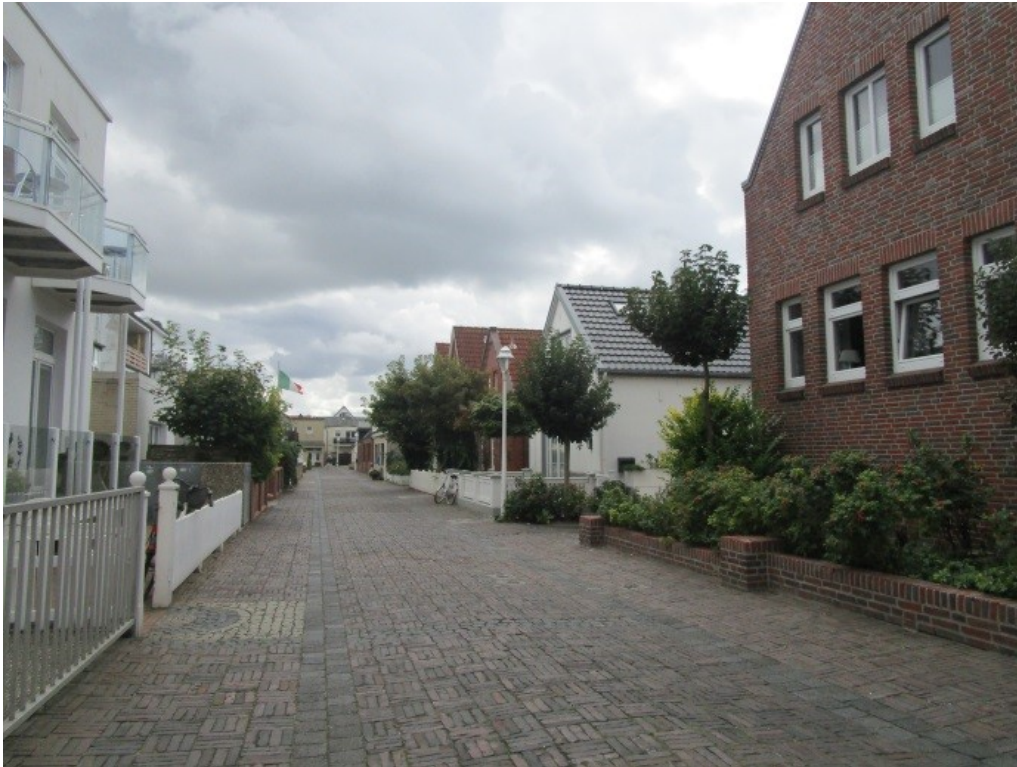
Abbildung 4: Straßenzug Bogenstraße (2020)