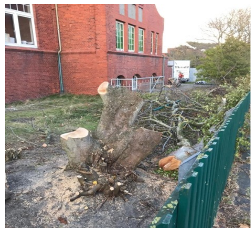
Abbildung 3: Baumbestand vor und nach der Abholzung in der Benekestraße (2018-2019)

Aufgrund der vergleichbar schmalen Straßenzüge in der Innenstadt ist die Gestaltung des Straßenraums durch Gehölze, Bäume, Sträucher und Hecken im Vorgartenbereich und Straßenraum ein wichtiges städtebauliches Gestaltungselement, um den öffentlichen Raum zu beleben.